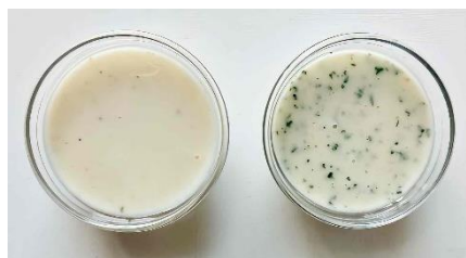
【甘酒レモンのクリーミードレッシング】 美肌食材：甘酒

レモン果汁によるビタミンC、甘酒にはビタミンB群による免疫力を高める効果や皮膚の代謝を高める効果があるため美肌作りには最適です。食物繊維やオリゴ糖など腸内環境の働きを助けます。