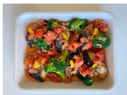
【焼きさばのゆずトマトおろしあえ】 美肌食材：ブロッコリー・トマト

レモン果汁によるビタミンC、甘酒にはビタミンB群による免疫力を高める効果や皮膚の代謝を高める効果があるため美肌作りには最適です。食物繊維やオリゴ糖など腸内環境の働きを助けます。