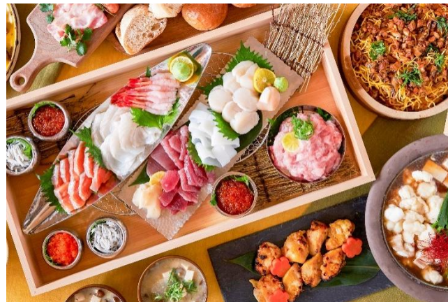
ベッセルイン高田馬場駅前の朝食