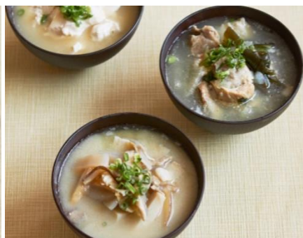
ソーキ汁／イナムドゥチ