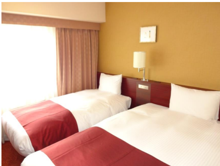
コンフォートツイン（2名利用時）